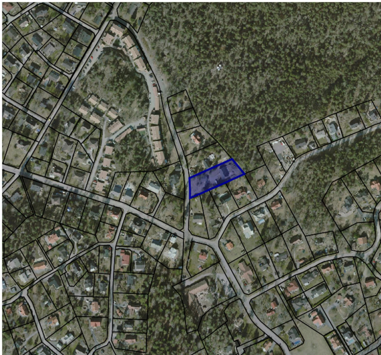
Ortofoto med fastigheten Vidablick 4 markerad i blå färg.