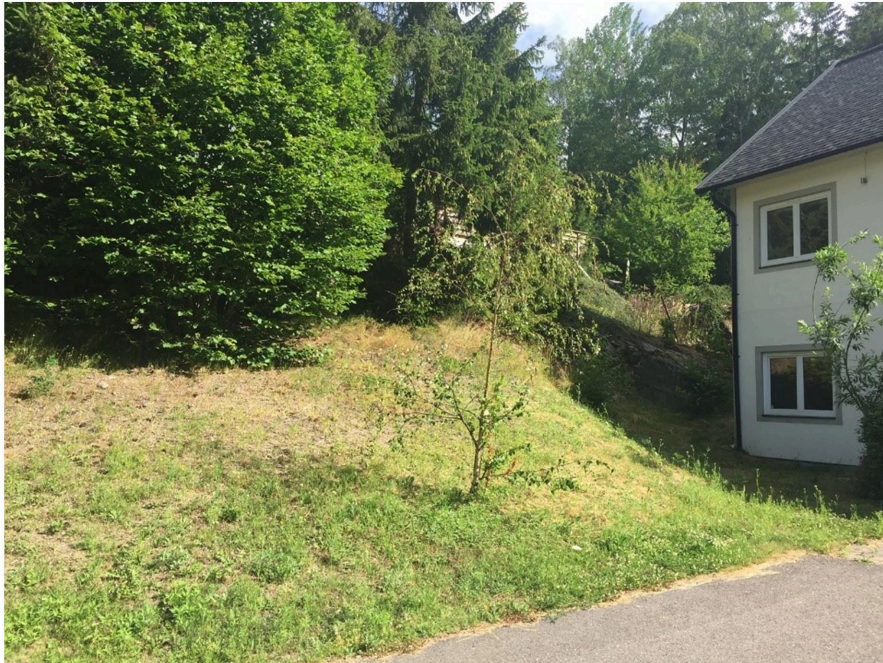
Bild som visar befintlig huvudbyggnad samt nivåskillnader mot grannfastigheten norr om fastigheten Vidablick 4.