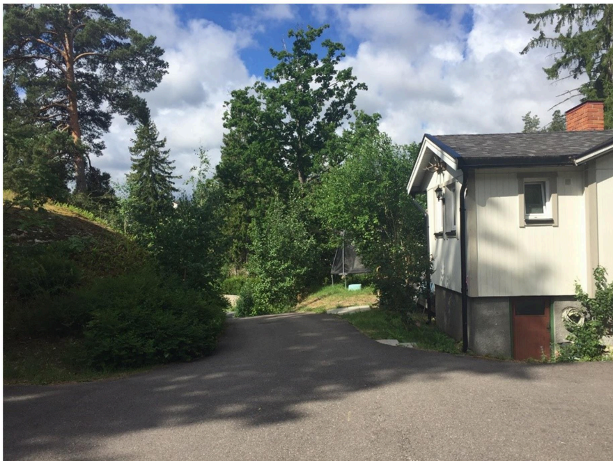
Bild som visar befintlig infartsväg som anpassar sig väl till bergsknallen söder om vägen. Befintlig komplementbyggnad till höger.

Marken inom fastigheten är kuperad och på flera ställen förekommer berg i dagen. Högst marknivåer finns längst in på fastigheten, närmast naturmarken. Befintlig huvudbyggnad ligger i suterräng och tar upp höjdskillnader. Framför befintligt bostadshus planar marken ut och har en öppen karaktär med gräsmattor och asfalterade ytor för biluppställning. Från befintlig komplementbyggnad sluttar marken förhållandevis brant ner till Vidablicksvägen. I sluttningen finns en större ek. Infartsvägen inom fastigheten anpassar sig till terrängen genom att vägen rundar en befintlig bergsknalle. Nivåskillnaderna är även stora mot grannfastigheten i norr.