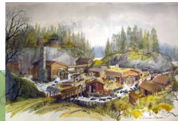
WÄTTINGE/NYFORS PÅ 1600-TALET. ILL: DAVID BRACKEN