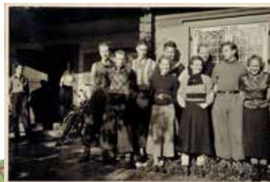
UNGDOMAR UTANFÖR HÄLLBERGA, 1930-TALET