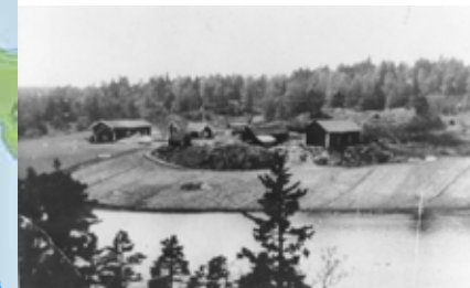
RUNDMAR PÅ 1930-TALET. FLYGFOTO