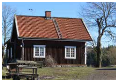
RUNDEMARS GÅRD 2015

12. Nedre kärret. Våtmarker är viktiga för paddor, groddjur och många växter.