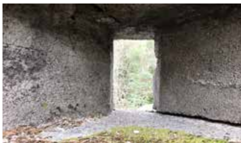
GAMMELSTRÖMSFORTET HAR 137 GLUGGAR

1. Gammelströmmen. Alens rötter skapar miljön vid strömmen. Strömstaren kan synas här tidig vår. Väster om bron finns såråkra i maj-juni, en växt som förr användes för att badda sår.