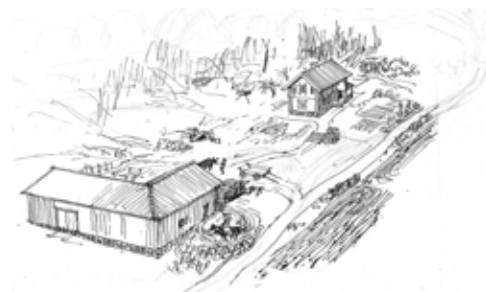
UPPSÄTRA, SKISS AV DAVID BRACKEN

6. Uppsätra torp (ruin). Torp byggt i mitten av 1600-talet av en arbetare i krutbruket i Wättinge, idag Nyfors. Det fanns kvar till på 1950-talet, då det brann ner. Sätra betyder utmarksäng. Till torpmiljön hör backnejlika, gulmåra, johannesört och såpnejlika.