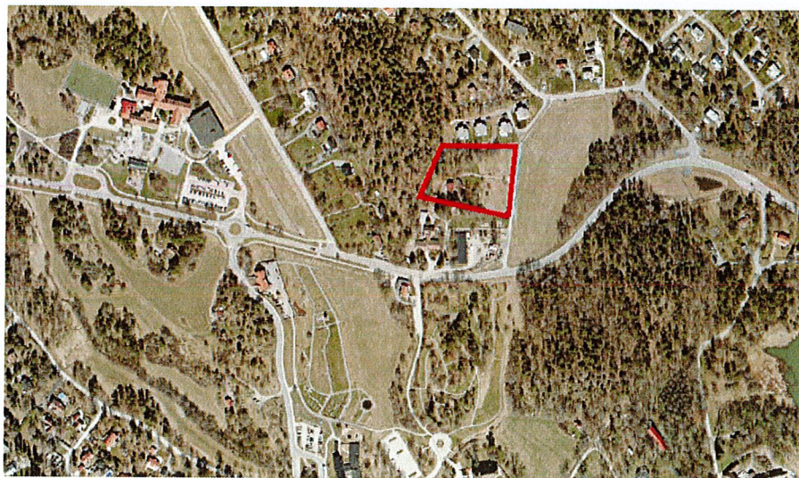
Figur 1. Ortofoto som visar planområdet markerat i röd färg