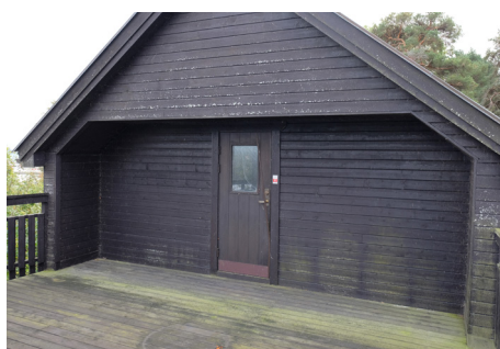
Bild 5 Utgång till terrass åt sjösidan.