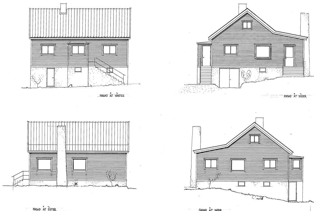
Figur 1 Byggnadslovsritning "Förändring av villa" från Tyresö kommunarkiv 1945