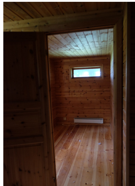
Bild 8 Interiör från tillbyggnaden våning en trappa.