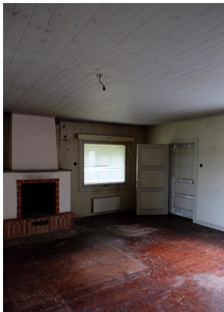
Bild 7 Interiör från entréväningen.