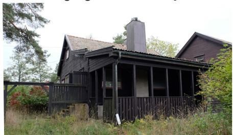
Bild 6 Huvudbyggnaden. Vy åt öster.