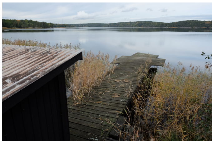
Bild 2 Bryggans hus och bryggan.