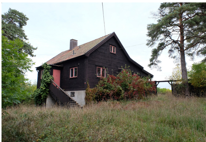
Bild 3 Huvudbyggnaden sedd från landsidan.