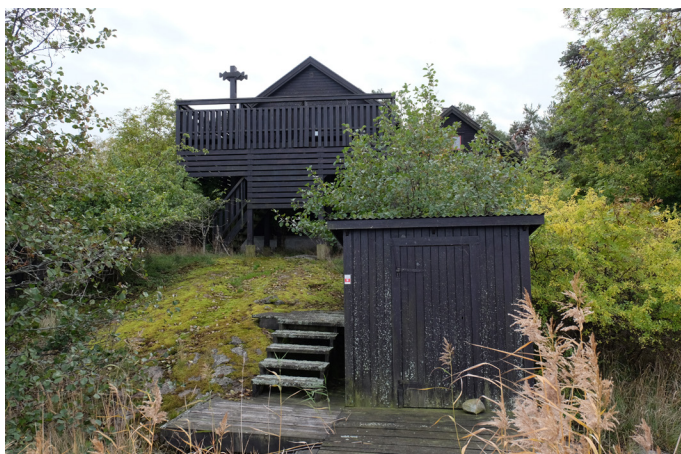
Bild 1 Huvudbyggnad sedd från sjön. Terrasstillbyggnaden på en stolpkonstruktion dominerar vyn. I förgrunden syns bryggans hus.