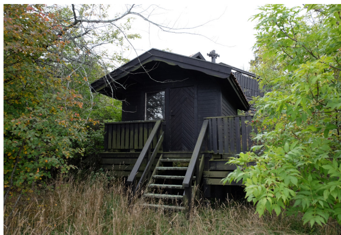
Bild 4 Den fristående boden.