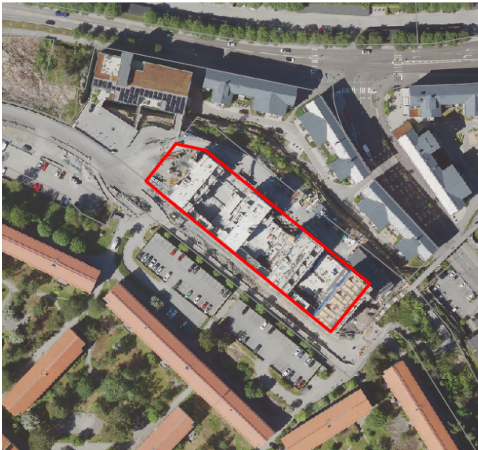
Figur 1. Ortofoto över bollmora berg 2