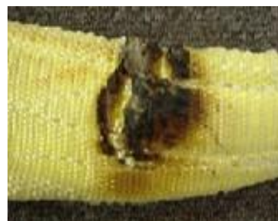
Smält eller brännmärken