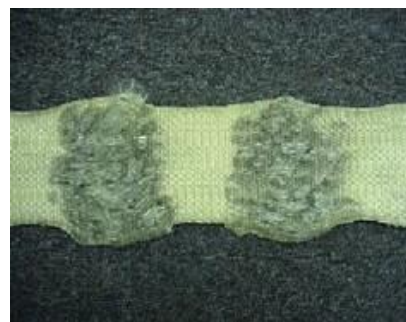
Revor / skadade band