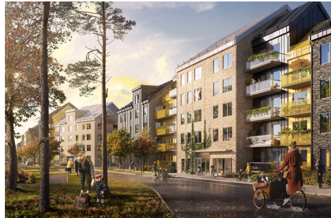
Bilder ovan för att förstå utformning och karaktär på området.