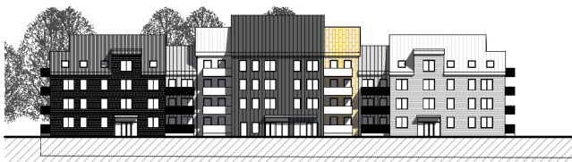
FASADER ÖVER KVARTER A MOT BOLLMORAVÄGEN