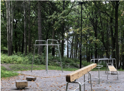
REFERENSBILD - UTEGYM

I områdets norra del ska nuvarande skogsområde med tallkog och hällar omvandlas till park för lek och samvaro. Naturlekplats och utegym ska bli parkens huvudsakliga innehåll, enligt önskemål från de boende. Utformningen ska anpassas till den skogskaraktär som området har idag.