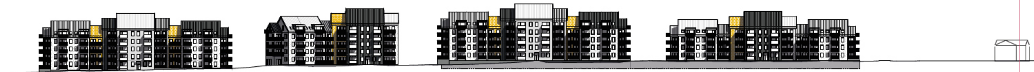
FASADER MOT PARKEN